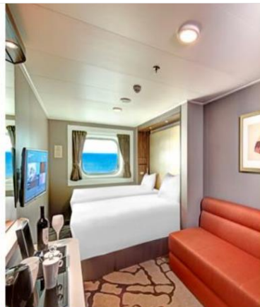
Oceanview Stateroom with Window