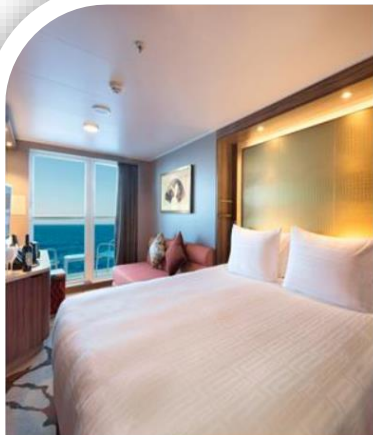
Oceanview Stateroom with Balcony